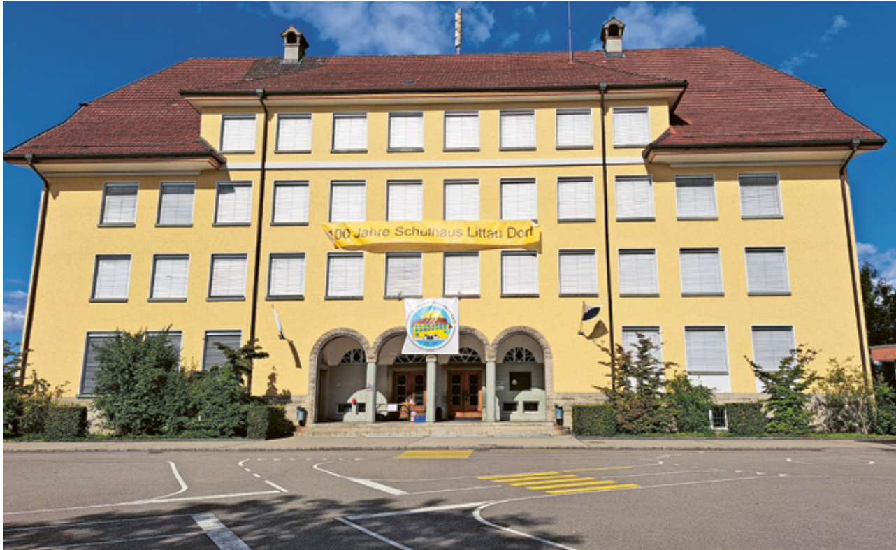
Das Schulhaus Littau Dorf im Jahr 2023. Die Fassade wurde erstmals 2008 saniert.