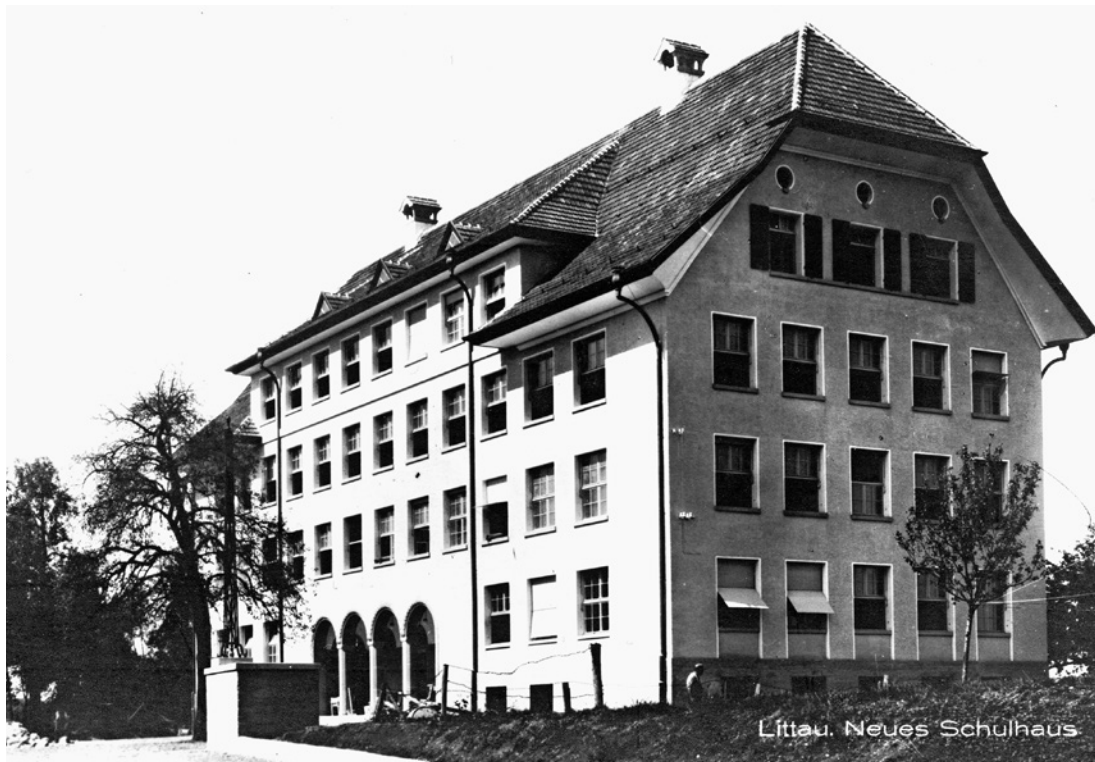
Das Schulhaus Littau Dorf 1923. Im ersten Geschoss rechts war von 1923 bis 1964 die Gemeindekanzlei Littau mit dem Zivilstandsamt untergebracht. Zuerst wohnte der Schulhausabwart, welcher auch für die Milch-Suppenküche zuständig war. In der heutigen Aula war die erste Turnhalle, in der auch die Musikproben und Gemeindeversammlungen stattfanden.