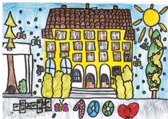
Das «Dorfschulhaus Littau» an der «Mattstrasse» (heute «Grubensstrasse 7»), wurde am 21. Januar 1828 feierlich eingeweiht. Nach einer grossen Erweiterung mit Anbau fand am 5. Mai 1889 eine grosse Einweihungsfeier statt, der Abendzirkel Littau spendete ein Zobig.